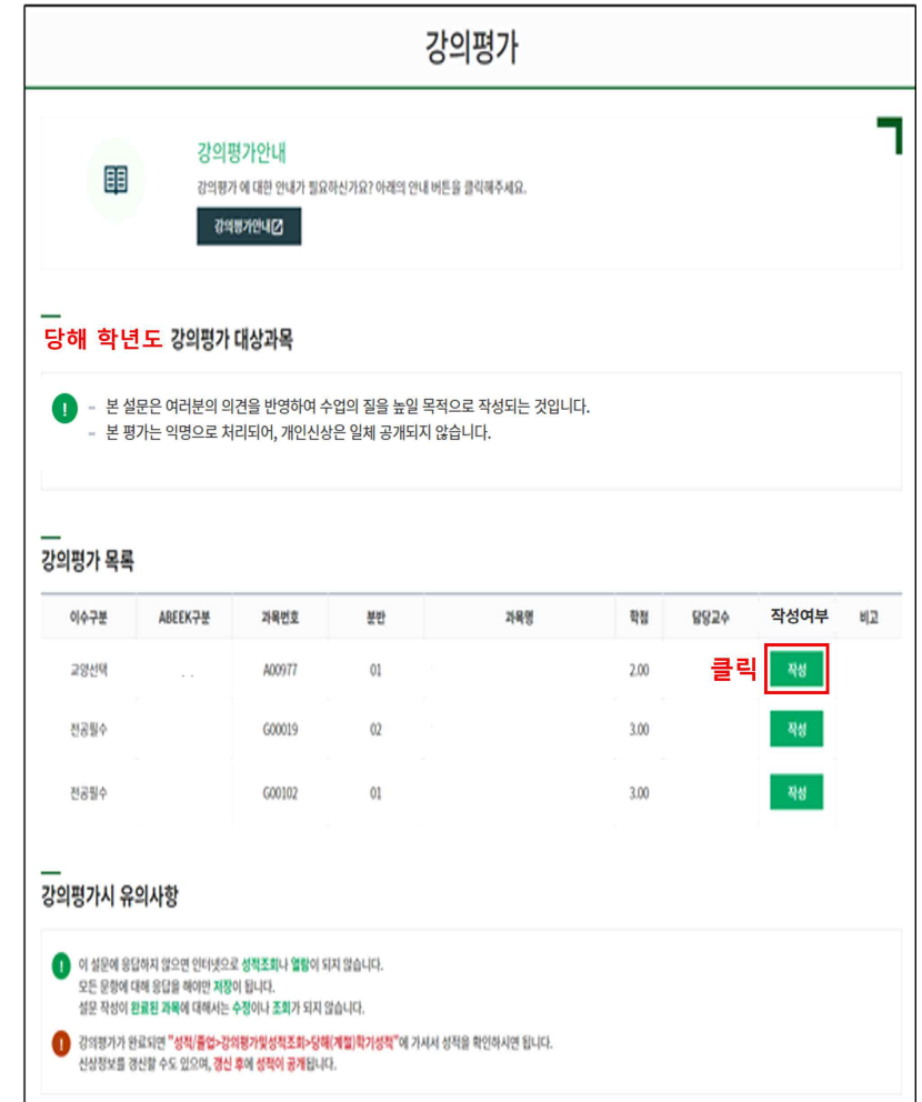
[그림 1-3] 강의평가 대상과목 목록 화면 (예시)