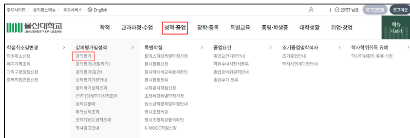
[그림 1-2] 강의평가 프로그램 접속 경로 화면